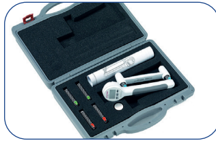
Maletín de transporte