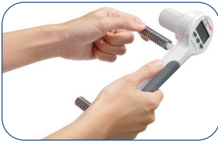
Fácil reemplazo de muelles