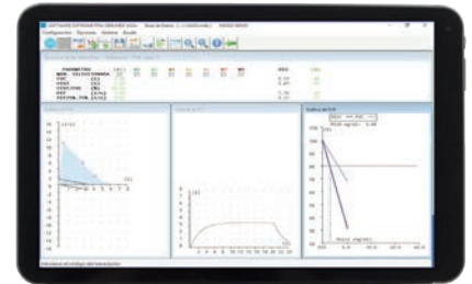
Apto para tablet con Windows 10