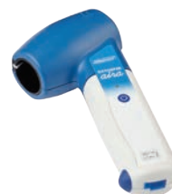
DATOSPIR aira TURBINA