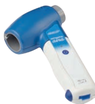
DATOSPIR aira FLEISCH