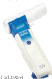
DATOSPIR aira DESECHABLE